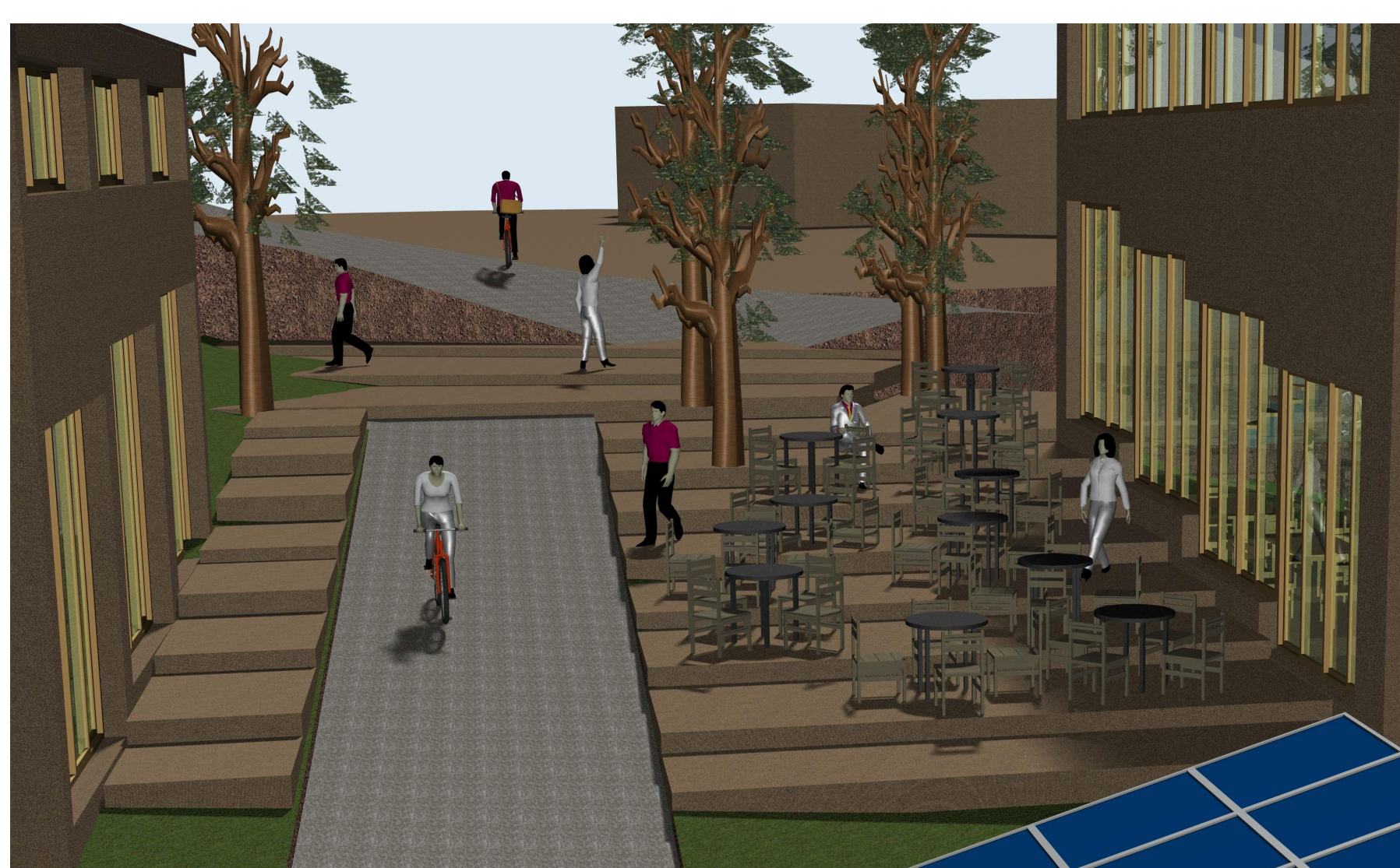
PERSPECTIVE D'UN ESPACE COMMUN