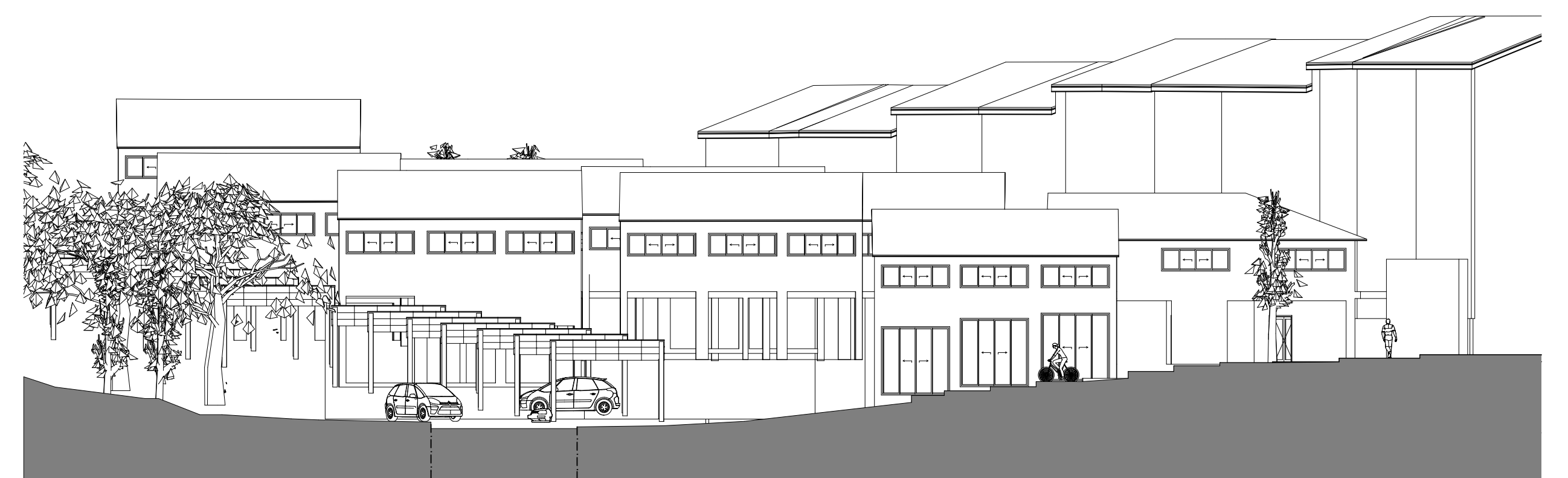
COUPE SUR LA RUE PIETONNE QUI DONNE SUR LA PLACE ECHELLE : 1/200°