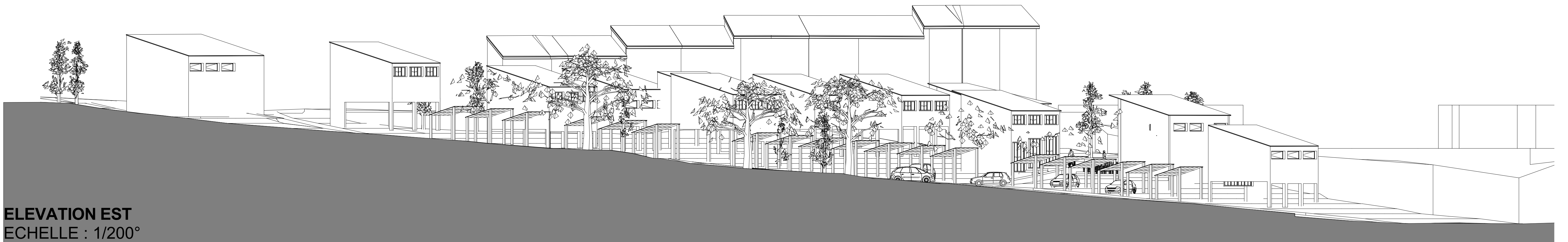
ELEVATION EST ECHELLE : 1/200°