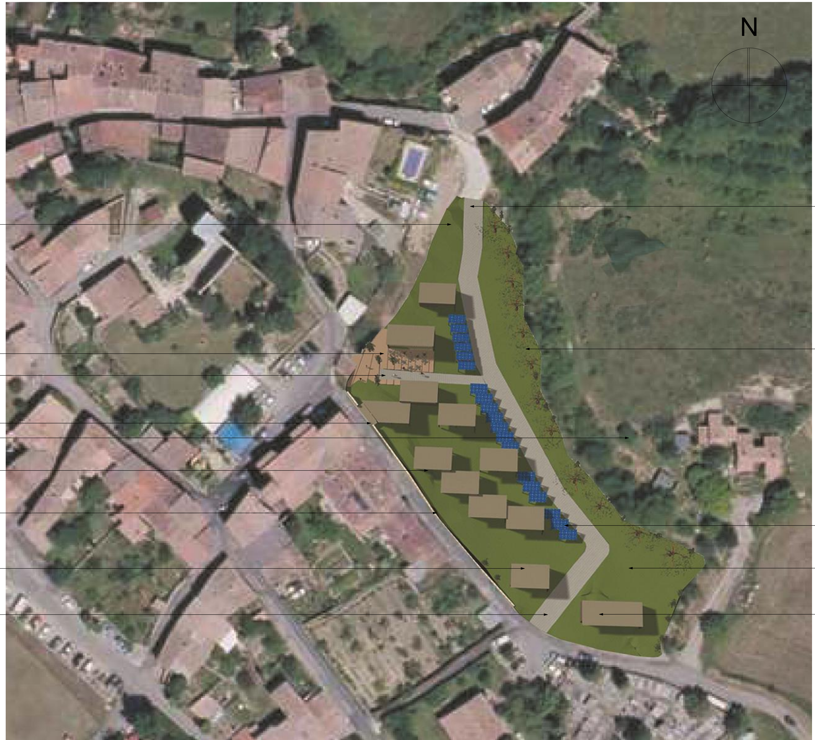
PLAN DE MASSE ECHELLE : 1/500°